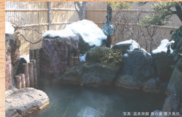
写真:温泉旅館 鹿の湯 露天風呂