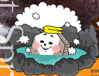
鹿部観光キャラクター カールス君